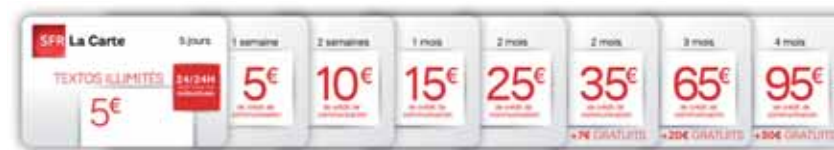
Les recharges iPhone ne sont pas compatibles avec les Forfaits Bloqués SFR.

IMPORTANT : Les durées de validité des recharges SFR La Carte ne s'appliquent pas aux Forfaits Bloqués SFR. Le prix de la minute est de 0,38€ (appels métropolitains uniquement).